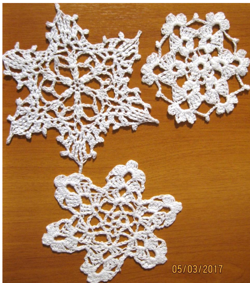
Снежинки выполненные в технике «Вязание крючком»